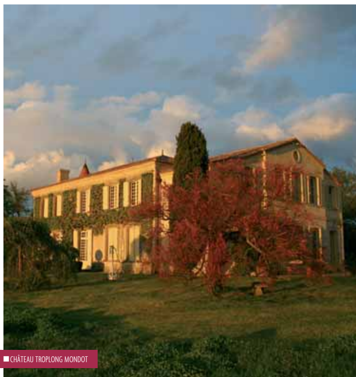
■ CHÂTEAU TROPLONG MONDOT

Le problème qui se pose, ce n'est pas tant les déclassés, les reclassés, ou les mouvements d'assiettes foncières, qui pourraient, effectivement, légitimement, faire débat, mais plutôt ce que ce nouveau classement a de déstabilisant dans l'inconscient collectif et commercial