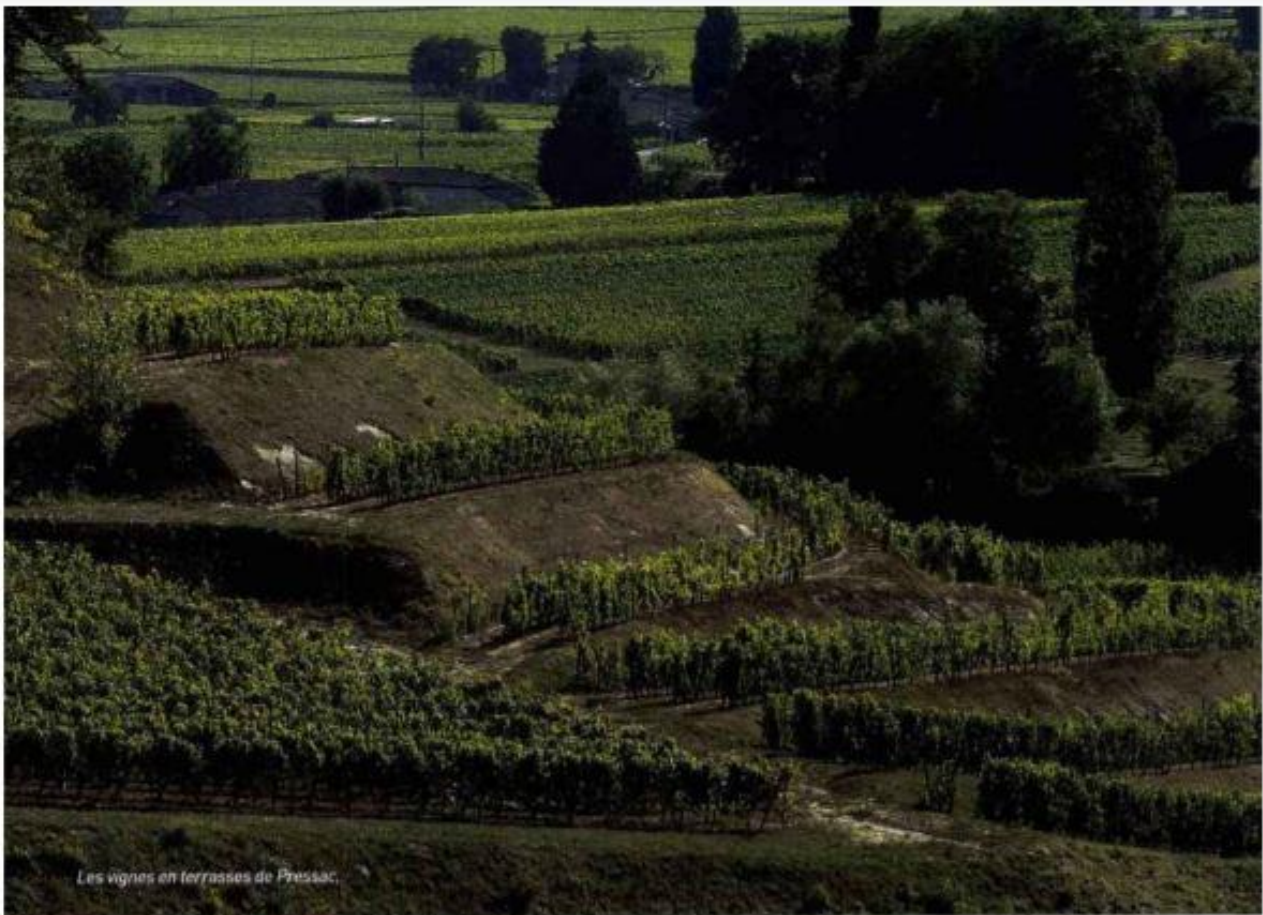
Les vignes en terrasses de Pressac.